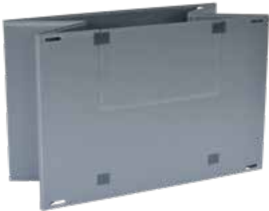
M-Faltung, Volumenreduktion durch Faltung auf Schmalseite

höchste Lastaufnahmekapazität und individuelle Dimensionierung