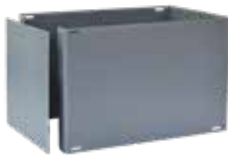
kurze Seite offen, C-Ring überlappt