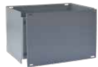
lange Seite offen, C-Ring überlappt