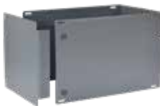
kurze Seite offen, Frontplatte überlappt