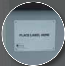
Placard Label Holder