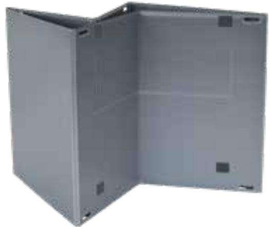
Z-Faltung, Volumenreduktion durch Faltung auf Längsseite