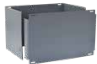
lange Seite offen, Frontplatte überlappt