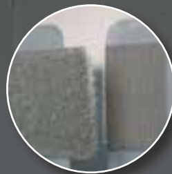
Klett- und Flaschband